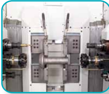
Bearbeitungseinheiten mit 1, 2 oder 3 Spindeln.