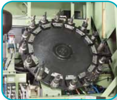
Werkzeugmagazine, ausgelegt als 8-fach, bzw. 16-fach Tellermagazine.