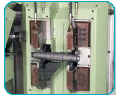
Werkstückspannvorrichtungen, zentrisch arbeitend, wahlweise mit 3-Punkt- oder 4-Punkt-Spannung.