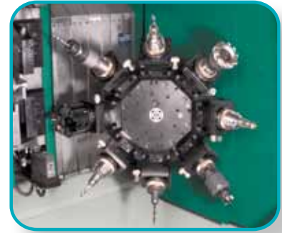
Bearbeitungseinheit mit 4-, 6-, 8-fach Revolver für kürzeste Span-zu-Span Zeiten.