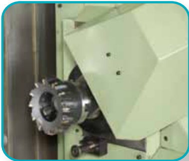
Automatische Werkzeugwechsler mit Doppelwechselalarm.