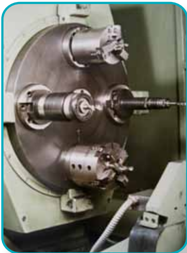
Robuste Bearbeitungseinheit mit 4-fach Scheibenwechsler.

Die Maschinen der Baureihe V 500 zeichnen sich aus durch einen konsequent realisierten, modularen Aufbau.