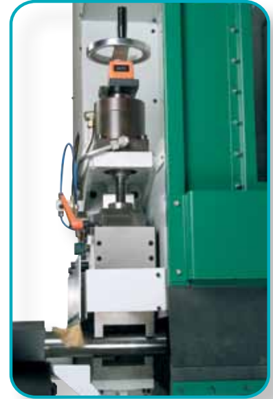
Stabile Spannvorrichtung, Öffnungshub begrenzbar zur Reduzierung der Taktzeiten.