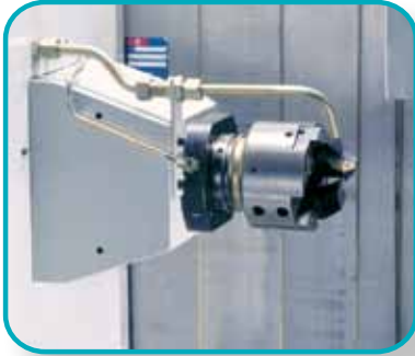
Längsschlitteneinheit mit Kombiwerkzeugkopf zum Anplanen und Fasen.