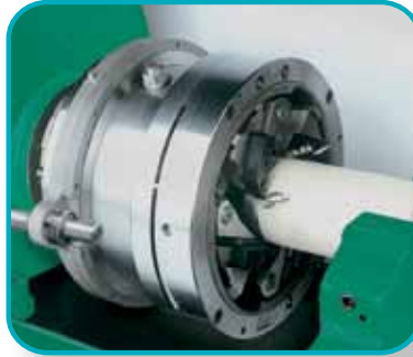
Längsschlitteneinheit zum Einsatz von Gewindegewinde-, bzw. Gewinderollköpfen.