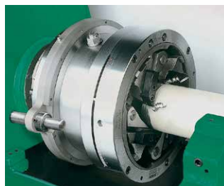
Zum Gewindeschneiden und Gewinderollen: Längsschlitteneinheit zum Einsatz von Gewindeschneidköpfen, bzw. Gewinderollköpfen