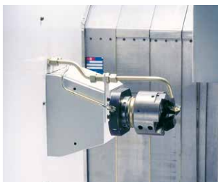
Zum Anplanen und Fasen: Längsschlitteneinheit mit Kombiwerkzeugkopf