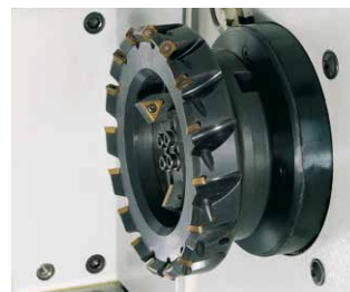
Zum Planfräsen und Anfasen: Kreuzschlitteneinheit