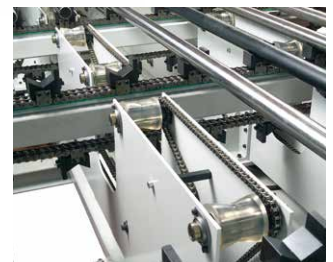
Kettentaktband mit Längsrollenbahn zum links- und rechtsbündigen Anschlagen der Werkstücke