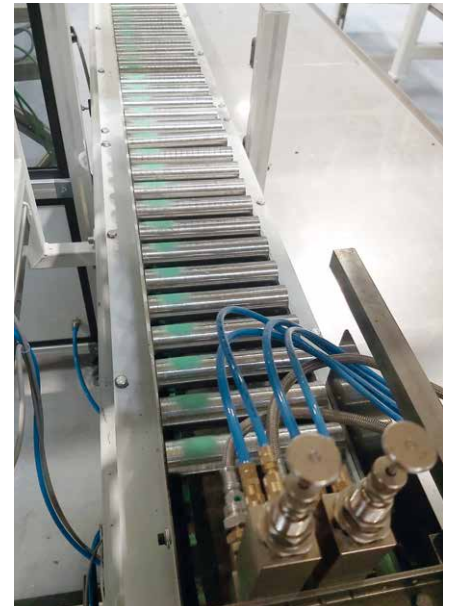
Abföhr-Förderband mit der Option Markierstation für IO/NIO.