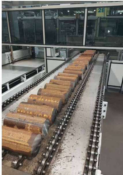
Zuföhr-Förderband mit Rollenband für variable Durchmesser und Längen.