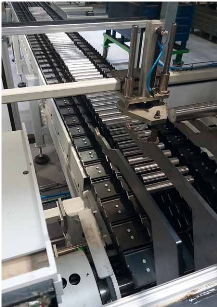
Zuföhr-Förderband mit Aushebung und Wellenprüfung auf Durchmesser und Länge.

Hier können wir Sie mit unseren individuellen Lösungen unterstützen. Ein Beispiel ist die Erweiterung Ihrer Bearbeitungsmaschine mit automatisierten Zu- und Abföhrbändern. Wir bieten zahlreiche Optionen – individuell auf Ihre Maschine abgestimmt.