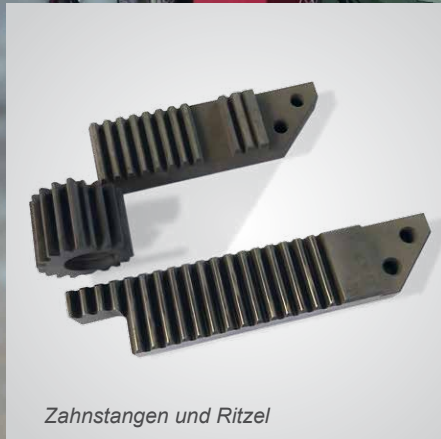
Zahnstangen und Ritzel