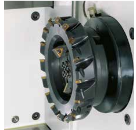
Kreuzschlitteneinheit zum Planfräsen und Anfasen.