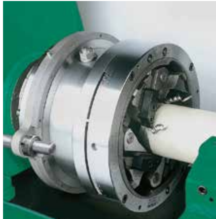
Längsschlitteneinheit zum Einsatz von Gewindeschneid-, bzw. Gewinderollköpfen.