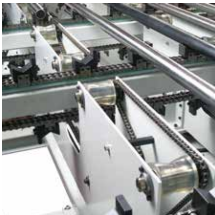
Kettentaktband mit Längsrollenbahn zum linksbündigen Anschlagen der Werkstücke für die Bearbeitung der ersten Seite, sowie zum rechtsbündigen Anschlagen der Werkstücke für die Bearbeitung der zweiten Seite.