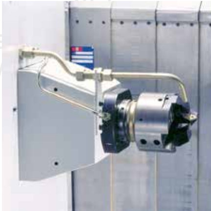
Längsschlitteneinheit mit Kombiwerkzeugskopf zum Anplanen und Fasen.