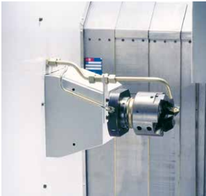
Zum Anplanen und Fasen: Längsschlitteneinheit mit Kombiwerkzeugskopf