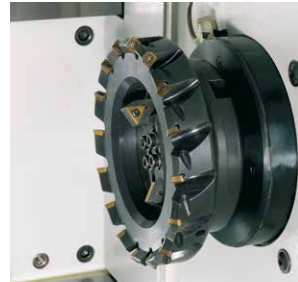
Zum Planfräsen und Anfasen: Kreuzschlitteneinheit