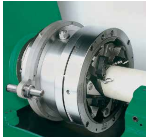
Zum Gewindescheiden und Gewinderollen: Längsschlitteneinheit zum Einsatz von Gewindeschneid-, bzw. Gewinderollköpfen