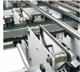
Kettentaktband mit Längs- rollenbahn zum linksbündigen Anschlagen der Werkstücke für die Bearbeitung der ersten Seite, sowie zum rechtsbündigen Anschlagen der Werkstücke für die Bearbeitung der zweiten Seite.